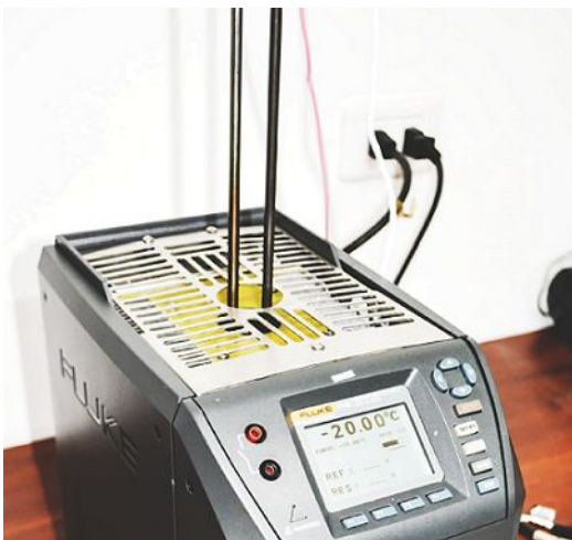
Figura 1 Calibración de una RTD por el método de comparación.